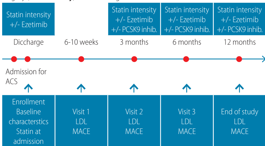
Slika 4. Algoritam praćenja bolesnika u registru republike srpske (RS-ASC)

Low-density lipoprotein cholesterol R eduction with state-of-the-art therapy in S econdary prevention and major cardiovascular A dverse events: Republic of S rpska registry ( RS-ASC study ). ClinicalTrials.gov Identifier: NCT05081336